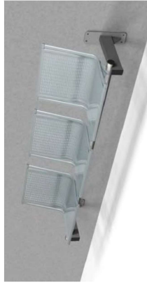
Gestell für Wandbefestigung