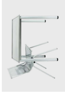
passende Tische, Modell 0720